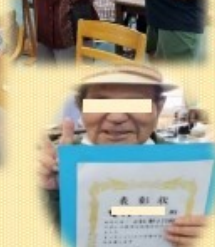
父の日祝い 焼きそばパーティー