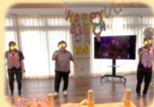
職員のお祝いダンス