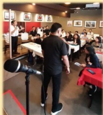
「介護福祉士候補生の面接」