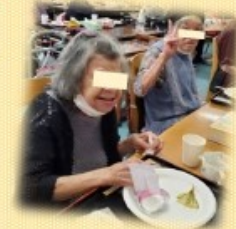
かるた作成... かるた大会 ▶