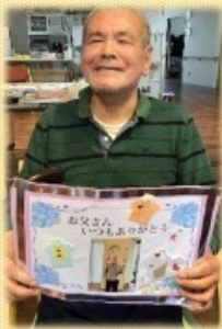
職員手作りメッセージカード