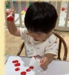
特別養護老人ホーム カール7ホーム