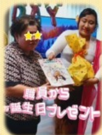
職員から誕生日プレゼント