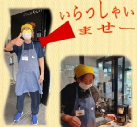
いらっしやいませー