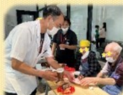
丁寧に お渡ししました

地域の皆様にはらして頂いたり突然のお声かけに快く参加くださったご家族様などでなんくるカフェ店員（利用者様）も喜んでいました。