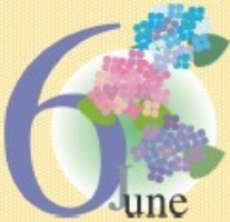
特別養護老人ホーム 皇すのら