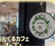
なんくるカフェオープン